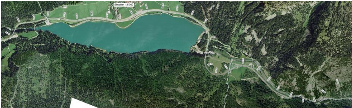
Markierung und Signalisation 1:5000